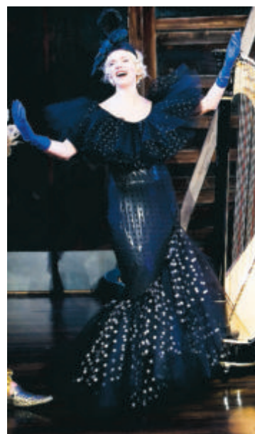
Glada änkans röv.